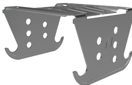
ХРЕСТОПОДІБНИЙ З'ЄДНУВАЧ 60/60 готовий до кріплення